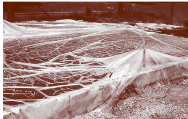
Figure 4 - Utilisation d'une pellicule de polyéthylène

L'utilisation de pellicules de plastique ou de papiers imperméables peut s'avérer suffisante sur des surfaces horizontales ou sur des bétons structuraux ayant des formes simples (figure 4). Ces méthodes diminuent le besoin d'apport d'eau continu et assurent une hydratation adéquate du ciment en empêchant l'eau de s'évaporer. Elles sont à éviter lorsque les surfaces apparentes du béton sont importantes, ainsi que par temps chaud à cause de l'effet de serre. Si le papier imperméable est abîmé pendant la période de protection, il faut réparer et sceller la partie endommagée.