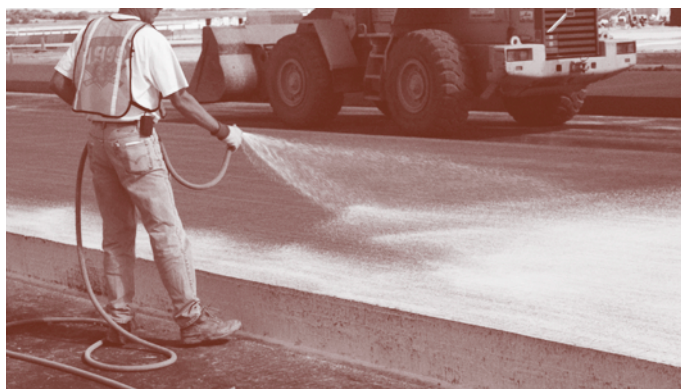
Figures 1 et 2 - Vaporisations d'un produit de cure formant membrane

Les produits de cure formant membrane sont composés de cire, de résines, de caoutchouc chloré et de solvants très volatiles et servent à réduire ou à retarder l'évaporation de l'eau du béton. Ils doivent être appliqués rapidement sur le béton frais ou sur les surfaces de béton après le décoffrage. De plus, ces produits doivent être vaporisés manuellement ou mécaniquement, en respectant le taux d'application recommandé par le manufacturier, et être appliqués au moment opportun (figures 1 et 2). Leur utilisation est à éviter pendant la période de ressuage du béton.