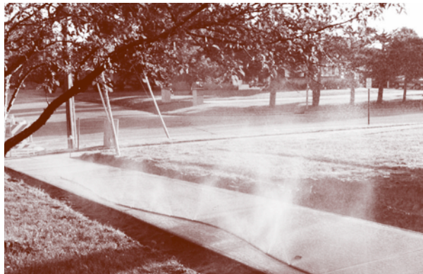
Figure 3 - Arrosage continu

L'arrosage continu ou la vaporisation sont des méthodes de cure souhaitables lorsque la température ambiante est \geq à 10°C et que le taux d'humidité relative est très faible (figure 3). Le béton doit demeurer humide, car l'alternance de cycles de mouillage/séchage altère la qualité de surface.